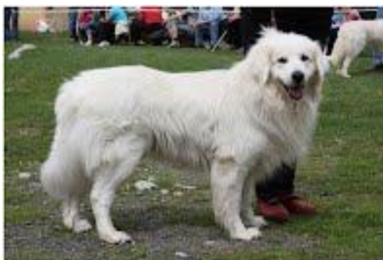
Amír Culkin dvor

Mezi významné plemeníky patřili: Šuhaj a Bojar z Oravskej priehrady, Cézár z Petržalských sadov, Lux z Velkého Choča, Ibro z Ranče N, Eso z Behy nebo Hil z Písecké rozhledny.