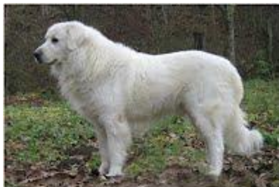
Dolly z Knížecího rodiště

Mezi významné předky patřili psi: Dingo Simba z Rokycanských vrchů, Cézár spod Kubínskej hole, Gero ze Zlaté studny, Doris z Ranče N, Asan z Kaolínového dolu, Ciran Panoráma Strakonice, Cézár z Tavíkovskej farmy. O znovu rozšíření této krevní linie se zasloužil ve své době jediný plemeník této linie Dolly z Knížecího rodiště.