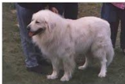
Ben z Kmeťovho polomu

Významnými plemeníky této krevní linie byli: Barbos Ibro a Blesk z Rokycanských vrchů, Harino z Trenčína, Alan z Kozinova kraje, Kazan z Kraslických pastvin, Ben z Kmeťovho polomu a Ciklon z Rokycanských vrchů.