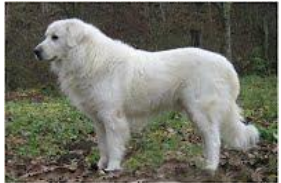
Dolly z Knížecího rodiště

Mezi významné předky patřili psi: Dingo Simba z Rokycanských vrchů, Cézár spod Kubínskej hole, Gero ze Zlaté studny, Doris z Ranče N, Asan z Kaolínového dolu, Ciran Panoráma Strakonice, Cézár z Tavíkovskej farmy. O znovu rozšíření této krevní linie se zasloužil ve své době jediný plemeník této linie Dolly z Knížecího rodiště.