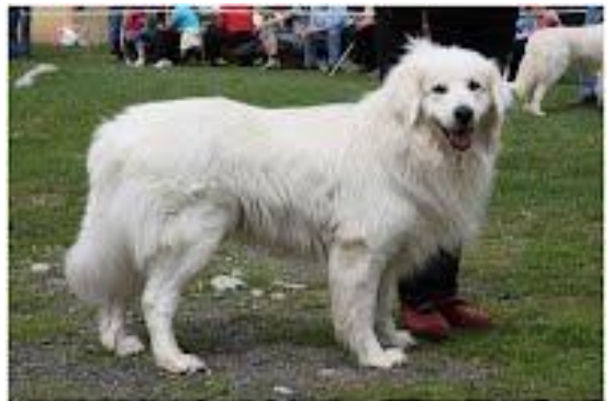
Amír Culkin dvor

Mezi významné plemeníky patřili: Šuhaj a Bojar z Oravskej priehrady, Cézár z Petržalských sadov, Lux z Velkého Choča, Ibro z Ranče N, Eso z Behy nebo Hil z Písecké rozhledny.